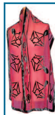
I.50310 - Charles