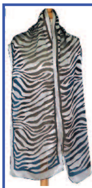
SVSAT001 - ZEBRA