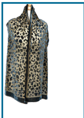
SVV001 - LEOPARD

réalisés avec des teintures Soie etuables et Viscose Alter-Ego de H-Dupont. Technique du Double-bain.