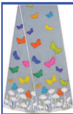
SVSAT002 - BUTTERFLIES