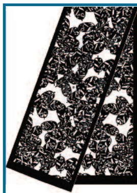
SVV002 - FEUILLES