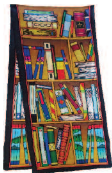
PWG121 - BIBLIO Écharpe 180x43cm Ponge-9 (Serti Noir) - 22,90€