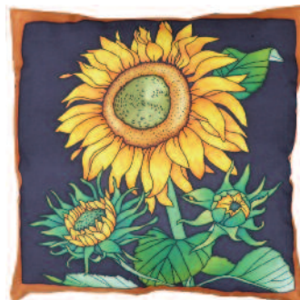
PWG119 - TOURNESOLS H. de coussin 40x40xm Pongé-10 (Serti Noir) - 15,50€