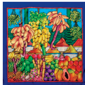
PWG117 - LE MARCHÉ Foulard 90x90cm Ponge-9 (Serti Noir) - 18,50€