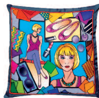
PWG113 - TENDANCES H. de coussin 40x40xm Pongé-10 (Serti Noir) - 15,50€