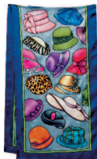
PWG114 - CHAPEAUX Écharpe 150x40cm Ponge-9 (Serti Noir) - 18,00€