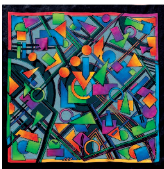
PWG115 - ABSQUARE Foulard 90x90cm Ponge-9 (Serti Noir) - 18,50€