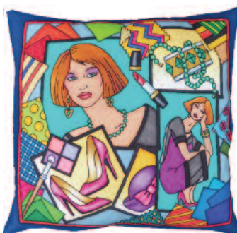
PWG118 - TENDANCES-2 H. de coussin 40x40xm Pongé-10 (Serti Noir) - 15,50€