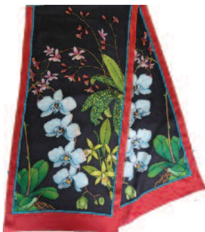
PWG120 - ORCHIDEE Écharpe 180x43cm Ponge-9 (Serti Noir) - 22,90€